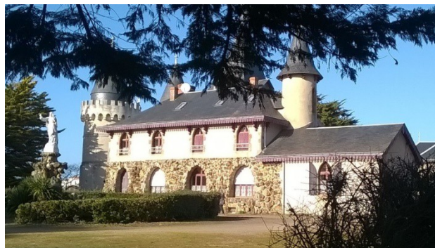
Chapelle Notre Dame de Bourgenay